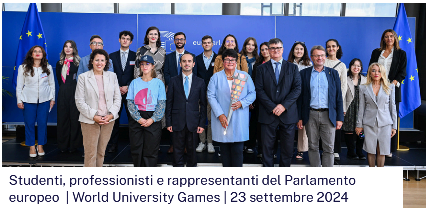
Studenti, professionisti e rappresentanti del Parlamento europeo | World University Games | 23 settembre 2024