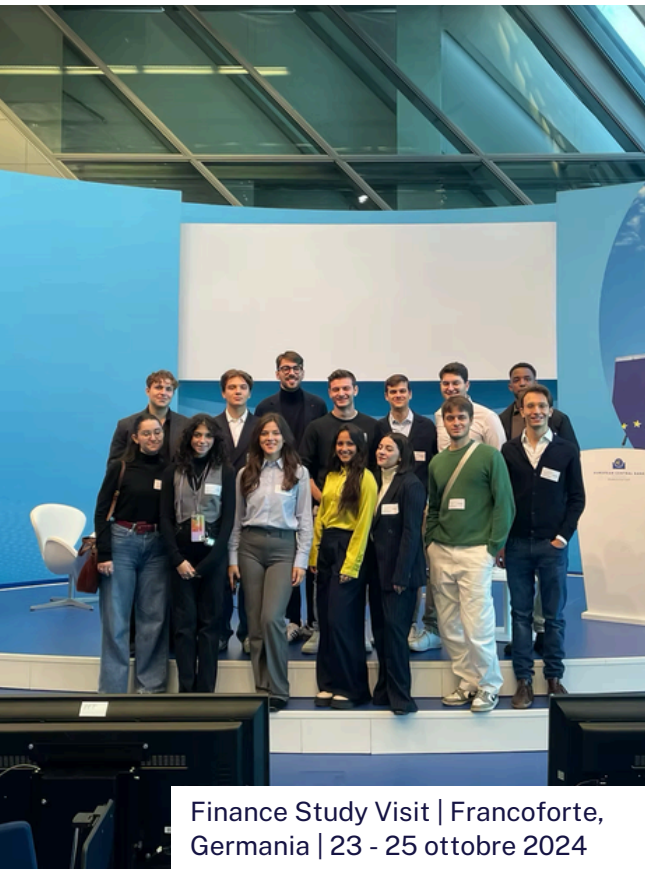
Finance Study Visit | Francoforte, Germania | 23 - 25 ottobre 2024