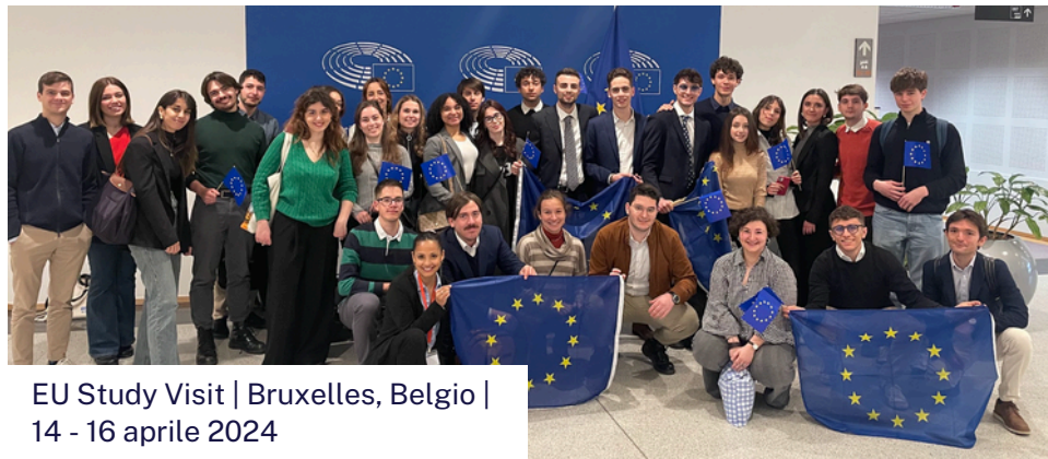
EU Study Visit | Bruxelles, Belgio | 14 - 16 aprile 2024