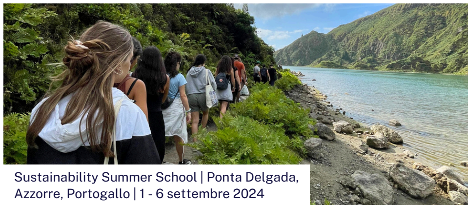
Sustainability Summer School | Ponta Delgada, Azzorre, Portogallo | 1 - 6 settembre 2024