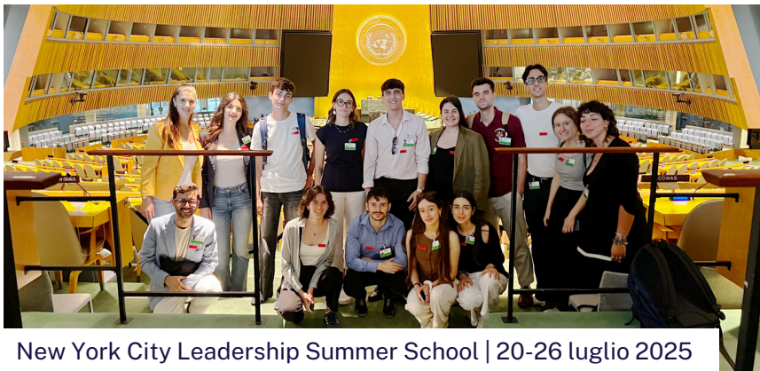
New York City Leadership Summer School | 20-26 luglio 2025