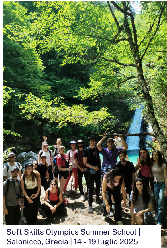
Soft Skills Olympics Summer School | Salonico, Grecia | 14 - 19 luglio 2025